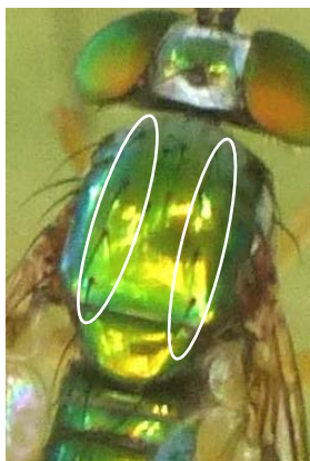
マダラホソアシナガバエ。白丸が背中刺毛(dc)。2 列ある。