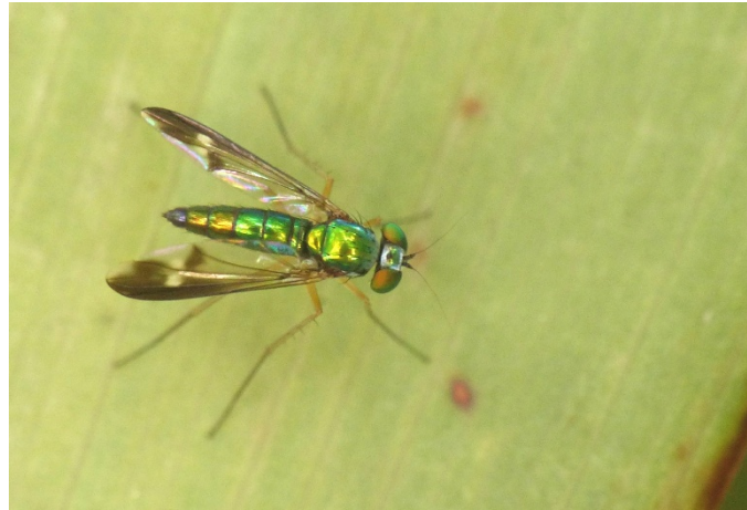
Condylostylus nebulosus (Matsumura, 1916) マダラホソアシナガバエ